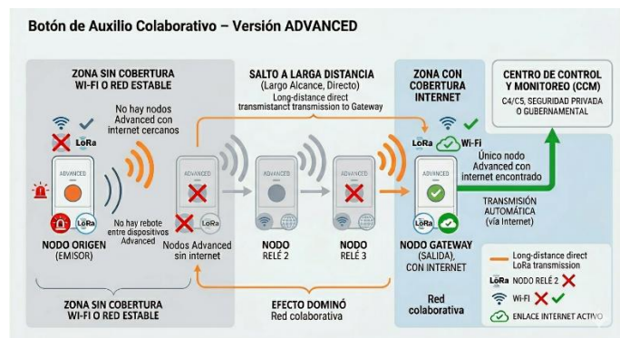
Ilustración 2 - - Diagrama de transmisión de alerta desde zona sin cobertura hacia centro de control mediante salto LoRa.